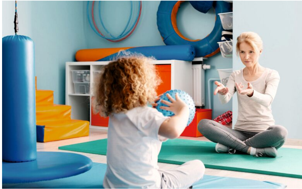
Ob Jung oder Alt, Therapeutinnen und Therapeuten können helfen, die Lebensqualität zu steigern.

Zwei ausgezeichneten Therapeutinnen und Therapeuten finden Sie auf dieser Seite. ■